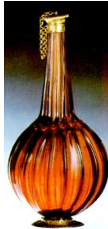
3 Angeblich süddeutsche Kugelbauchflasche aus Goldrubin mit Rippendekor. Die Montierung ohne Marken. Kunstgewerbemuseum Prag