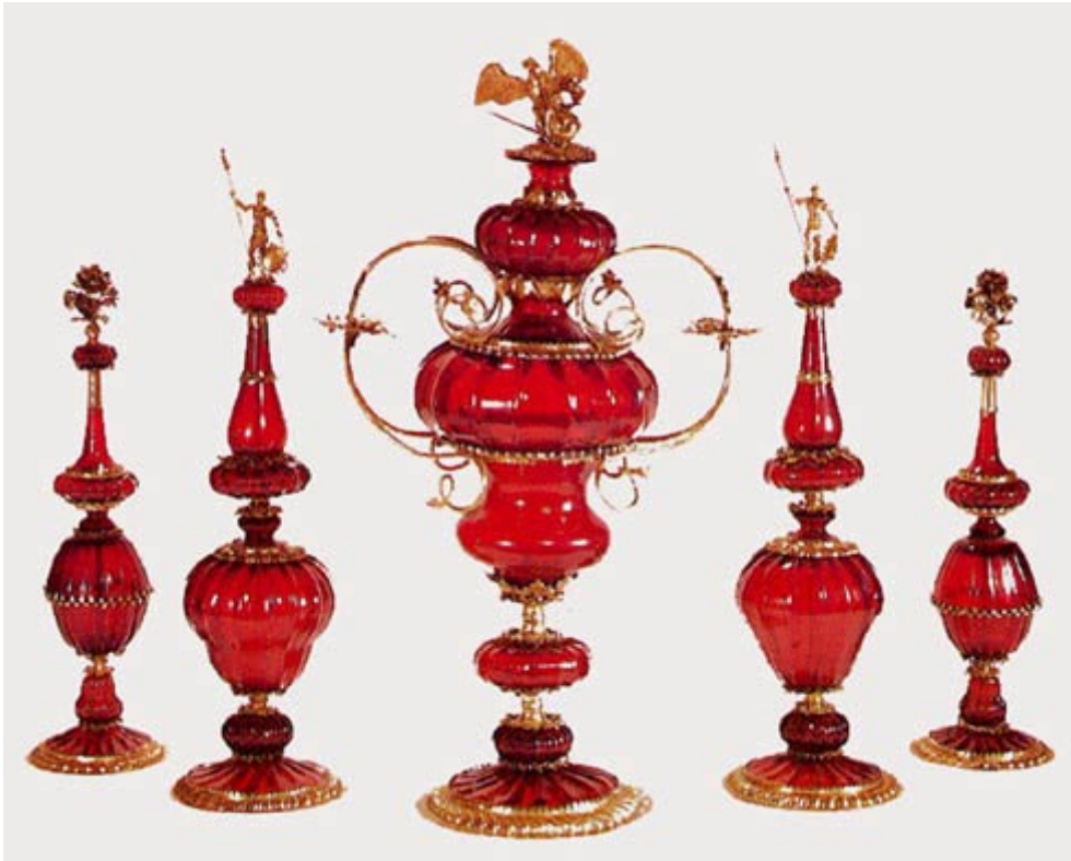
2 Fünfteiliger Vasensatz aus Goldrubinglas mit Montierung (Augsburg), 1698 (?); SMPK, Kunstgewerbemuseum, Berlin

1700 viele Rubingläser mit Silbermontierungen und wohl auch geschnittenen Ornamenten versehen wurden, Süddeutschland als Ursprungsgebiet von Goldrubingläsern in Anspruch zu nehmen, wie dies im Fall von fünf gerippten Rubinglasvasen mit Augsburger Montierung im Berliner Kunstgewerbemuseum geschah. [8] Hier wird – wohl unter Berufung auf Orschall – vermutet, dass den Bemühungen Kunckels in Potsdam »die Versuche anderer vorausgehen, die mit hoher Wahrscheinlichkeit noch vor der Kommerzialisierung seines Verfahrens in Süddeutschland zu praktischem Erfolg führten. Die Herstellungsphase der süddeutschen Rubingläser überschneidet sich zeitlich mit den Anfängen seiner [Kunckels] eigenen Produktion. Bis heute ist es nicht gelungen, die infrage kommenden Erzeugnisse mit den urkundlich genannten Hütten in Verbindung zu bringen.« [9] Folglich legte man sich nicht fest und verständigte sich auf Süddeutschland.