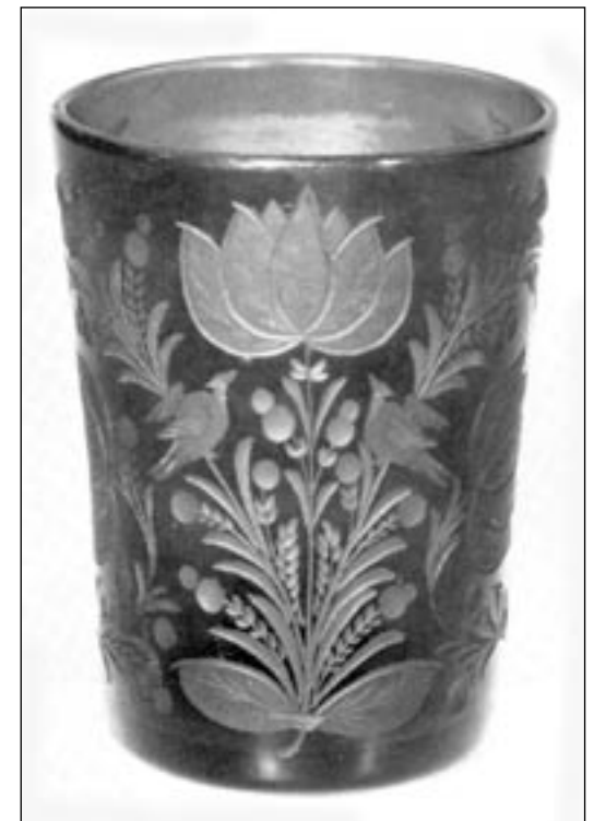
7 »Süddeutscher« Rubinglasbecher mit Wappen des bayerischen Kurfürsten Max Emanuel (1662-1726) und »Heel-Dekor«. Sotheby's London, Auktion 29. 9. 1975, Nr. 226

Es ließen sich noch viele Beispiele beibringen für überholte Zuschreibungen an Süddeutschland, München und Freising. Der in Zwiesel angebotene Deckelbecher jedenfalls stammt nicht aus Freising, schon eher aus Böhmen. Das tut der Bedeutung des Glases aber keinen Abbruch, sondern liefert einen weiteren Beweis für die hohe Qualität des in Böhmen erzeugten Rubinglases.