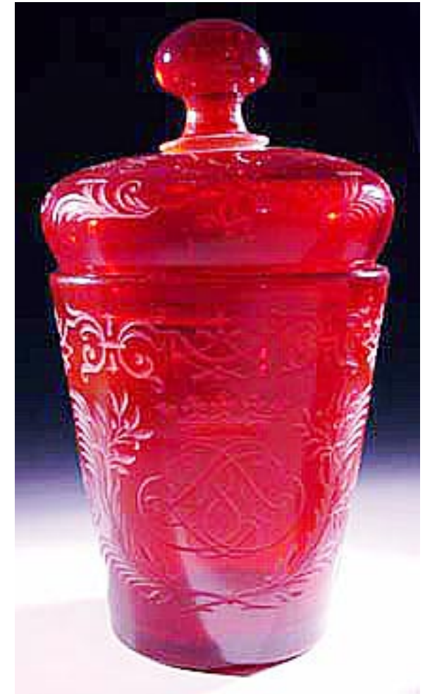
1 Goldrubin-Deckelbecher, »süddeutsch, wohl Freising«, Anfang 18. Jh. H. 19 cm. Auktion in Zwiesel, 1. Juli 2000, Nr. 125

Johann Kunckel ging es jedoch nicht um künstliche Rubine, sondern um ein wirkliches rotes Goldglas in einer Zusammensetzung und in genügenden Mengen, um daraus in hüttenmäßiger Verarbeitung durch Blasen und Formen Hohlgefäße herzustellen. Deshalb sah er in Neris »theurem und kostbarem Modus« keinen praktischen Nutzen. Viele hätten es versucht, »aber darinnen wenig Vergnügen gefunden.« Er selbst wohl auch nicht, denn die Herstellung seines berühmten Goldrubinglases gelang ihm nach eigenem Bekunden erst, nachdem er etwa um 1685 von Dr. Cassius' Praecipitatio Solis cum Jove Kenntnis erlangt hatte. »Als ich dies erfuhr«,