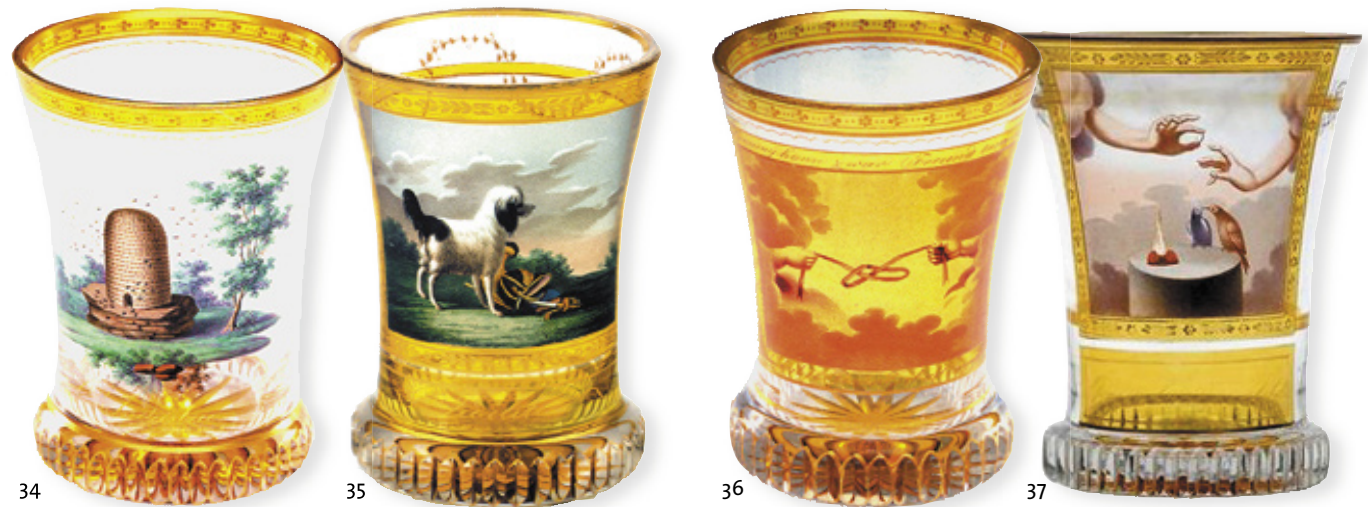
34 Bienenkorb auf Landschaftsinsel »L'Industrie«. – Wiener Kunst Auktionen, September 1994, Nr. 244