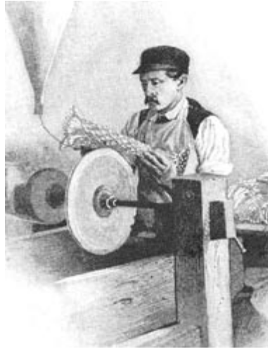
Abb. 6 Diese Zeichnung aus der Zeit um 1900 zeigt einen Glasschleifer bei der Arbeit am Kuglerstuhl mit einer keilförmig abgedrehter Schleifscheibe zum Schleifen von Keilschliffen, hier auf einer Vase. Aus dem trichterförmigen Gefäß links oben fließt durch ein Kupferröhrchen ständig Wasser auf die Scheibe, um die Reibungshitze niedrig zu halten.

Eine der wichtigsten Schliffgrundformen neben Flächen beziehungsweise Ecken und Kugeln oder