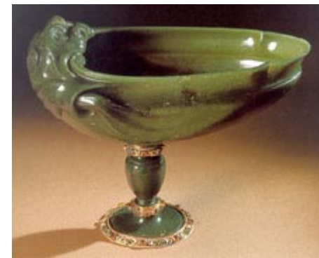
Abb. 1 Geschliffene Fußschale aus Jade, 1590-1600.

Man kann den Glasschliff als die Fortsetzung der Steinschneidekunst bezeichnen, mit der beispielsweise in der Renaissance aus rohen Schmucksteinen wie Jaspis, Jade oder Bergkristall kostbare Gefäße für die Kunstkammern der Kaiser und Fürsten gearbeitet wurden (Abb. 1). Als die Funde edler Steine in entsprechenden Größen seltener wurden, konzentrierte man sich auf die Entwicklung eines künstlichen Werkstoffs, der die gleichen Eigenschaften wie Bergkristall hatte und sich mit den gleichen Werkzeugen wie dieser veredeln ließ. Es entstand eine neuartige, auch in dicken Wandungsstärken kristallklare und nahezu fehlerfreie harte Glassorte, der so genannte böhmische Kristall, der nach 1680 dem bis dahin marktbeherrschenden und geschmacksprägenden venezianischen Glas Dank der Wirkung des