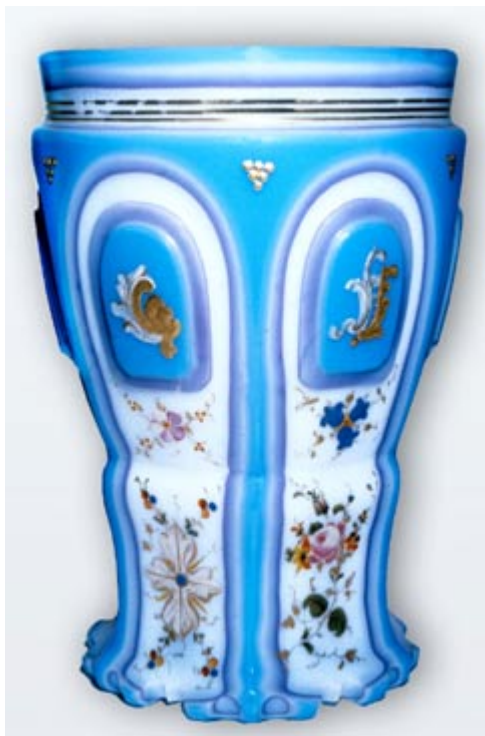
Abb. 10 Becher aus Milchglas mit zweifarbig blauem Außenüberfang. Böhmen, um 1845. Die blauen Schichten wurden teilweise abgeschliffen, wobei weiße Flächen neben blauen und farbige Ziersäume entstanden.

mit feinem Poliersand) geschieht. Bei den heute überwiegend verwendeten Bleikristallgläsern geschieht das Polieren nach dem Feinschleifen im Säurepolierbad mit Fluorwasserstoff.