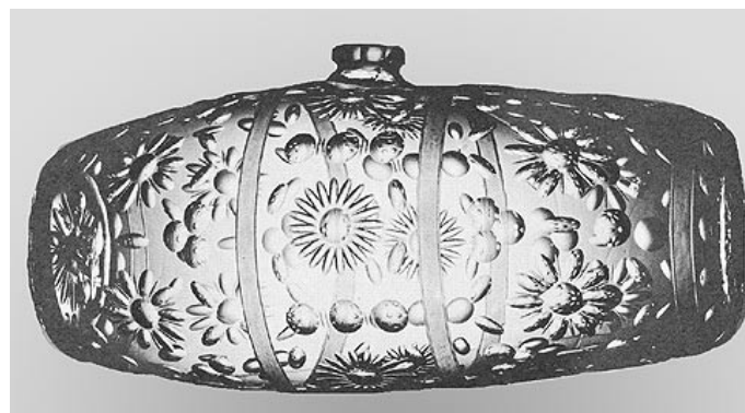
Abb. 5 Schnapsfäßchen mit Kugelschliff. Böhmen, 1720/30. Aus Kugeln und schmalen, langgezogenen Oliven wurden, wie dieses Beispiel zeigt, einfache Blumenmuster komponiert.

Als nächstes kam die Kugel und mit ihr der »Kugler«, wie er noch heute genannt wird, auch wenn er neben Kugeln noch viele andere und weitaus kompliziertere Schliffmuster hervorbringt. Um eine Kugel oder Olive zu schleifen, brauchte man Schleifsteine mit abgerundetem Profil. Zuerst behalf man sich damit, dass man den ursprünglich geraden Rand des waagrecht rotierenden Schleifsteins abrundete und den Hohlglaskörper dagegen drückte. Aber diese Scheiben waren verhältnismäßig dick und hatten einen großen Durchmesser, so dass sich damit nur große flache Kugeln sowie bis zum oberen und unteren Gefäßrand durchgehende, leicht konkave »Hohlecken« und »Schäler« mit bogenförmig auslaufenden Enden (auch Pflaumecken genannt) schleifen ließen. Deshalb ging man zu kleineren und schmalen Schleifsteinen über, die erheblich leichter