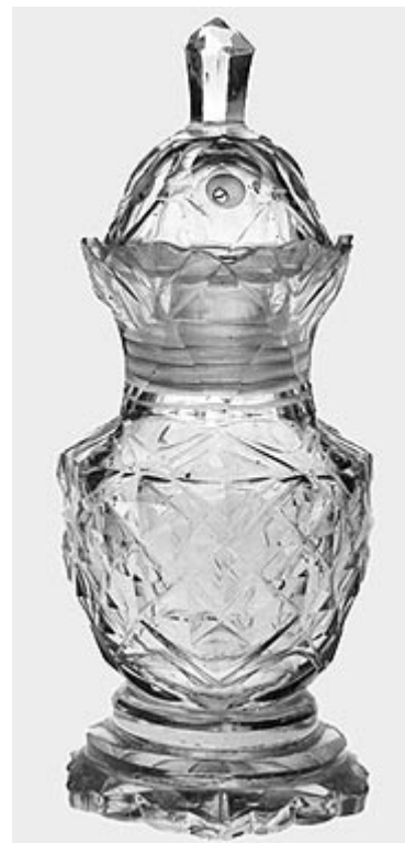
Abb. 2 Zuckerstreuer mit Schraubdeckel und Steinelschliff. England oder Böhmen, Ende 18. Jh. Gut zu erkennen das eingeschliffene Gewinde an der Innenfläche des Halses, dem ein Außengewinde im unteren Teil des Deckels entspricht.

Bevor der Schleifer mit der Arbeit beginnen kann, muss das Schliffmuster unter Berücksichtigung der jeweiligen Gefäßform entworfen und in Umrissen